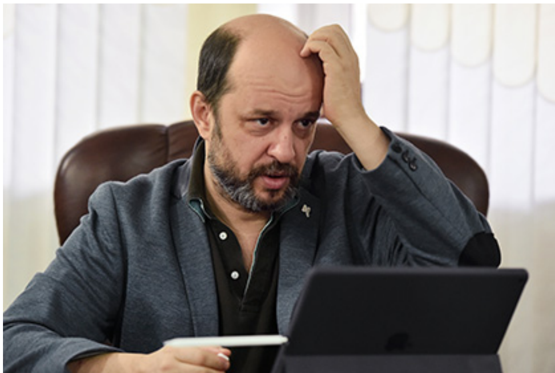
Герман Клименко

Советник президента России по проблемам интернета Герман Клименко заявил, что система контроля за переговорами сотрудников компаний по мобильным телефонам, которую разрабатывает компания InfoWatch, противоречит закону. Об этом он в среду, 11 мая, сказал радиостанции «Говорит Москва» .